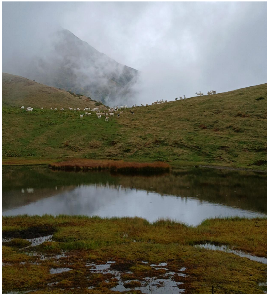
Сфагновая сплавина на озере Лахта (на горизонте – одноименная гора и козы)

В сумерках с трудом в траве находим тропу, которая спускается с хребта на восток. Долгий крутой спуск в темноте с фонарем. Тропа очень хорошая, так что это не вызывает проблем. По пути нигде нет воды (хотя слышно ревущий поток) и ровного места, так что спускаемся до самого русла реки