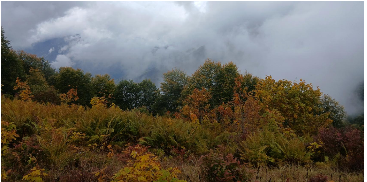
Краски осени на выходе в альпику (урочище Чамагвара)