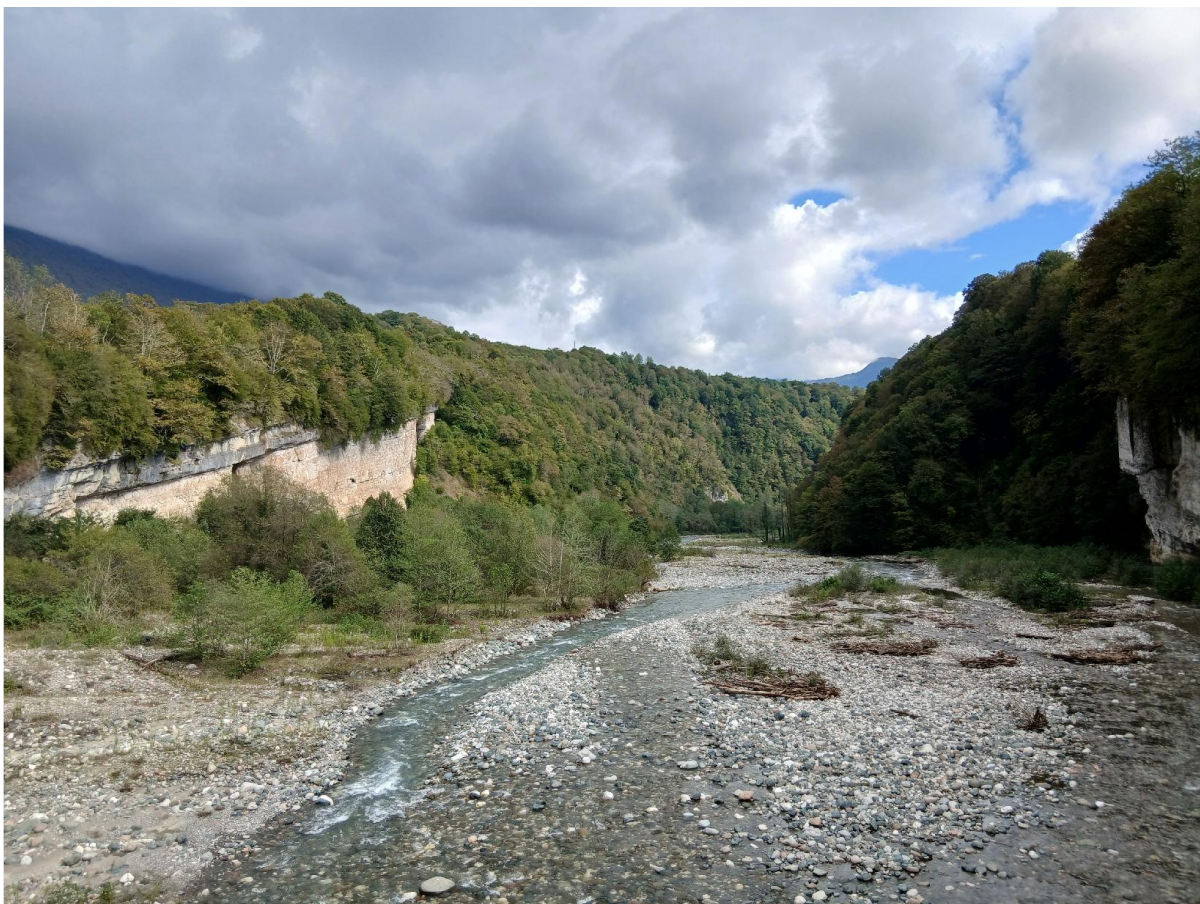
Кодорское ущелье поблизости от поворота на озеро Амткел

Приехали на поезде в Сухум. На старом знакомом к позднему обеду доехали до поворота на оз. Амткел. На озере какая-то тусовка (мы слышали ее, проходя над восточным берегом озера на удалении от него).