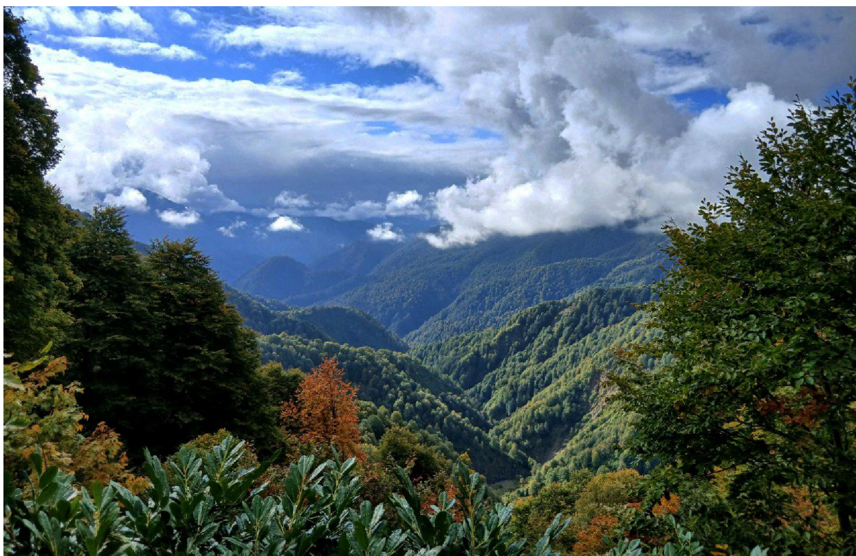
Эта фотография сделана пару дней назад, на подъеме от урочища Партхал, но сегодня виды были бы примерно такими, если бы погода не подвела

После обеда тропа пропадает вовсе (так и на OSM). Траверсом верховой р. Амткел идти уже слишком сложно (кусты, крутой травяной склон). Нужный нам перевал в долину р. Схапач выглядит так страшно, что мы около получаса просто сидим и продумываем альтернативные варианты (типа вернуться, пойти в долину реки Чхалта и скитаться так до пенсии). Начинается морось. Хотя... на противоположном склоне вроде бы виден какой-то серпантин от старой тропы. Наконец, мы берем себя в руки, потихонечку спускаемся к реке, и... понимаем, что подняться на перевал вовсе не сложно! Вскоре выходим на тропу, минуем отмеченный туром перевал и спокойно идем вдоль верховой р. Схапач ее левым берегом. Развалины полиэтиленового укрытия и, на другом берегу, хорошая копаная тропа траверсом долины! Вот это счастье!