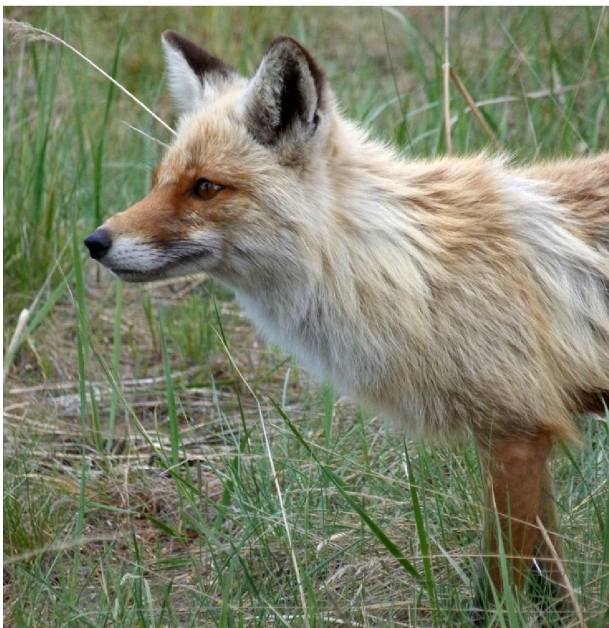
Слегка ободранная, но гордая лиса

стопы своим ледяным дыханием. Однако и этого хватило для заряда свежести на остаток дня.