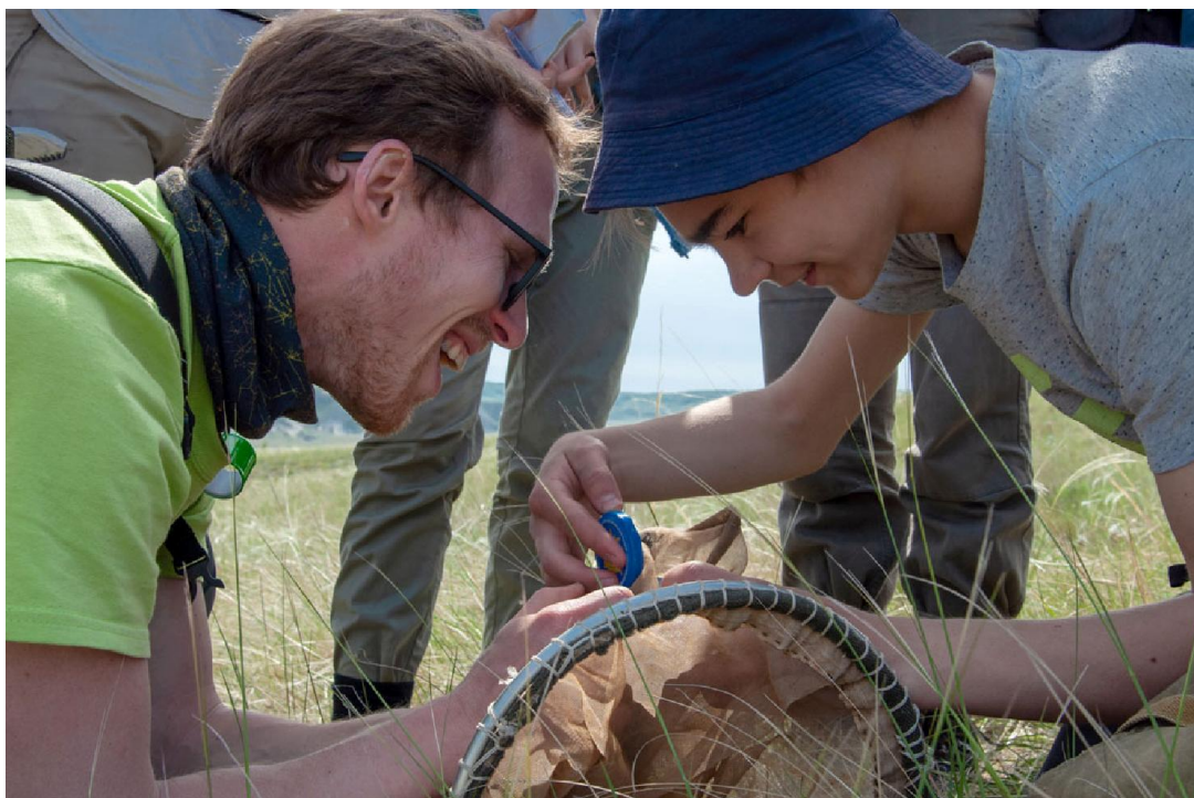
Один из двух монстров был пойман и залит килолитром этилацетата

невдалеке от которых ползла жирная чёрная майка, переливающаяся в стрелах света красным, зелёным и синеватым.