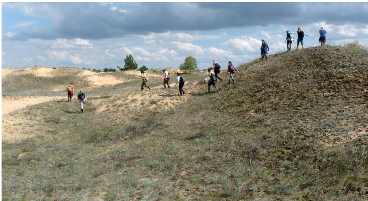
Местная природная достопримечательность – песчаные неровности

Собравшись за пятнадцать минут, мы покинули лагерь. Нашей целью оказались Арчединско-Донские пески, местная природная достопримечательность.