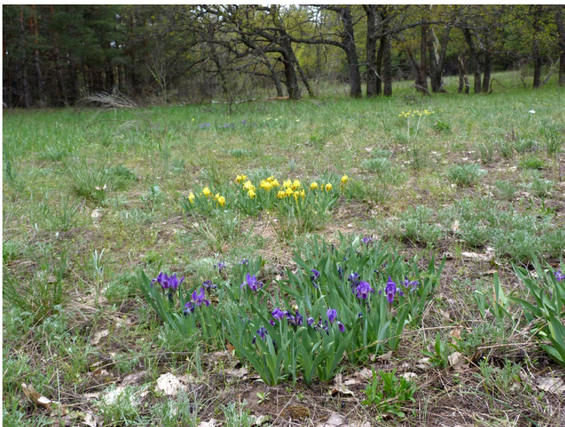
Опушка, покрытая разноцветными ирисами

Пейзаж был прекрасен: оставив кусочек жёлтого поля с сухими коричневыми свечками прошлогодних заразиц, мы укрылись под тенью леса (урочище Грядина), предварительно выкопав жирный и до того момента счастливый чернокорень. Опушки, покрытые фиолетовыми и светло-лимонными ирисами, запах которых удивлял своим разнообразием, сменялись таинственной тенью деревьев. Таинственно было всё: и звуки птиц, и покачивание веток, и где находится вода, чтобы пить и есть. Однако, посмотрев на карту, мы осознали, что ближайший водоём далеко. Пройдя ещё немного и увидев кабана (вернее, его заднюю часть), немедленно скрывшегося в зарослях, мы остановились и в несколько минут покончили с сухарями, шоколадками и частью чая. Спрятав следы пиршества, мы вновь двинулись вперёд.