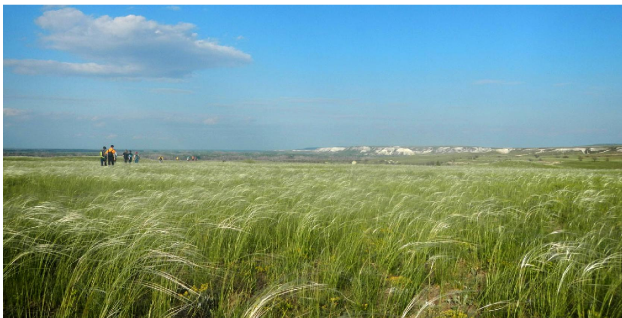
Шагаем по колышущемуся ковыльному озеру