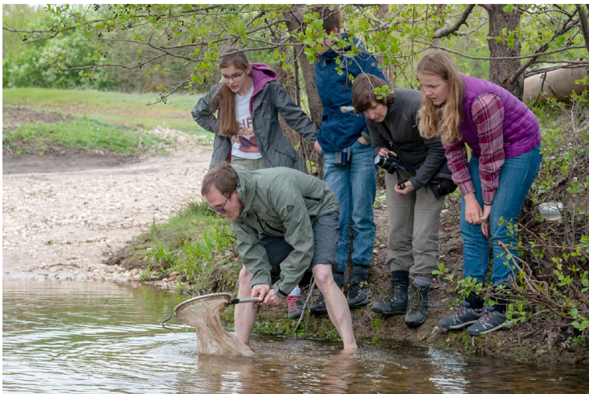
Восторженные возгласы и плотоядные выкрики – охота на миногу началась

бодростью, наслаждались ехидным пением местных лягушек, несущимся снизу от реки. Наконец разведчики вернулись. Местом, где мы собирались обосноваться, оказалась милая лысина небольшого леса около речки Арчеды.