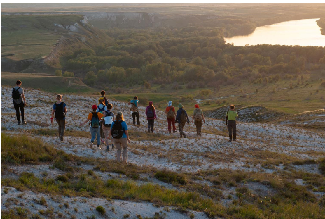
В свете вечернего солнца мел будто покрывается карамельной корочкой

Посидев на возвышенности высотой 250 м и вполне насладившись намёком на ветер, мы двинулись в направлении лагеря. Звучит красиво. На деле, мы впервые повернулись лицом туда, где за километрами пути стоит милая синенькая палатка. В свете вечернего солнца мел будто покрывается карамельной корочкой; самому кажется, что идёшь в разбавленном апельсиновом соке.