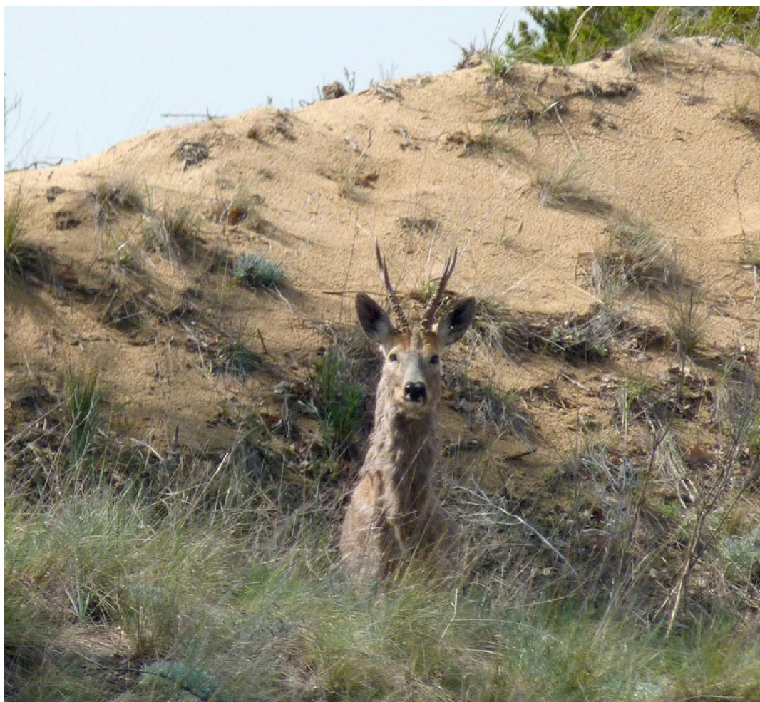
Косули недвусмысленно напоминают о приближении обеда